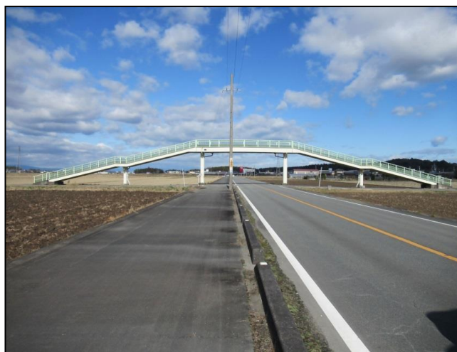
町道田丸世古線1号歩道橋