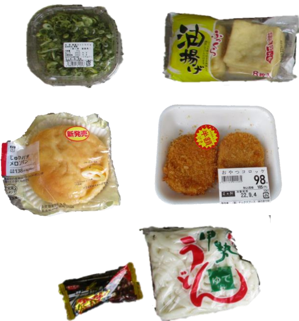
未開封の食材や食品が多数含まれていました