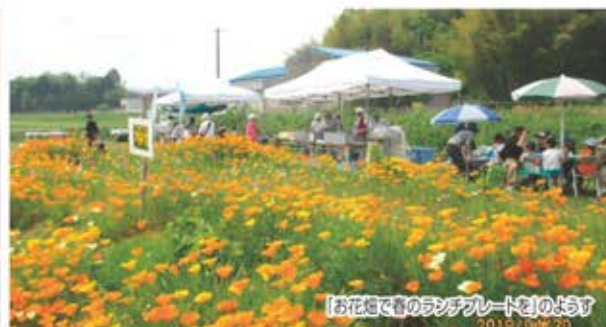
「お花畑で春のランチプレート』のようす 2018/10/29