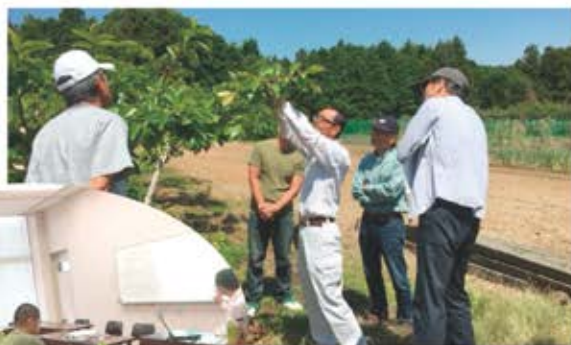
講習会のような様子