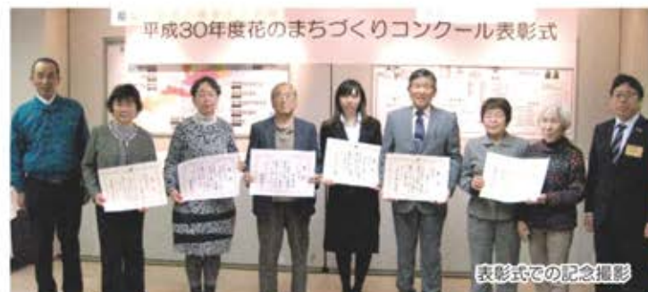
表彰式での記念撮影

大藪会長は、「受賞は大いに励みになります。管理作業は大変ですが、これからもみなさんに喜んでもらえるようスタッフ一同でがんばってきれいな花を咲かせたい。」と受賞の喜びを語っていました。