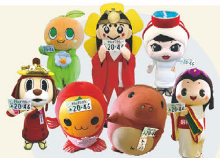
伊勢志摩ナンバープレート交付対象

※図柄入りナンバープレートは、「希望ナンバー制度」による申込み(受注生産)となります。 図柄入りナンバープレートは、上の表の交付手数料に加え、1,000円以上の寄附をすればフルカラーになります。