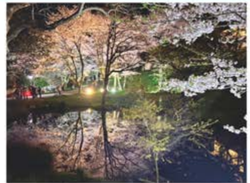
田丸城跡 桜のライトアップ(2024年撮影)