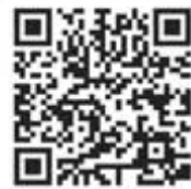
玉城町制70周年 記念ロゴマーク 使用ガイドライン

広報紙「玉城町制70周年記念特別号」を作成しました。玉城町が誕生した昭和30年からの広報紙に掲載されている記事を基に作成しました。70年の思い出をなつかしんでいただければ幸いです。