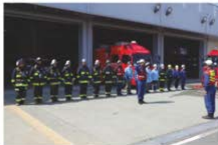
昨年度実施の様子