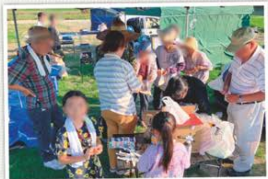
「みんなで新米を食べよう!」イベントの様子

自治区活動の支援では、自治区活動の支援として、将来的な自治区運営の相談や自主防災会設立後の活動などに関する助言を行っています。