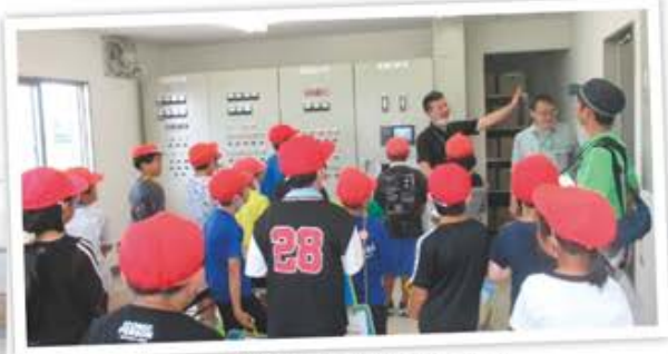
三郷・昼田処理場見学の様子

有田小学校4年生の児童が、社会見学で町の上下水道施設を訪れました。山岡水源地浄水場では、汲み上げた水の処理の過程や、配水池まで水道水を送るポンプなどを見学しました。また、三郷・昼田処理場では施設内の見学のほか、処理水の確認や下水処理に関する見学を行いました。