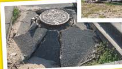
液状化の影響で 飛び出ている マンホール