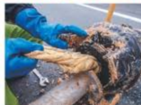
マンホールポンプにタオルが詰まっている様子

町の下水道に油などを流してしまうと、排水が詰まる恐れがあるので流さないでください。昨年度は異物の混入により下水道管が閉塞したり、ポンプが故障したりする被害が7件発生しました。快適に下水道をご利用いただくため、正しい使用にご協力をお願いします。