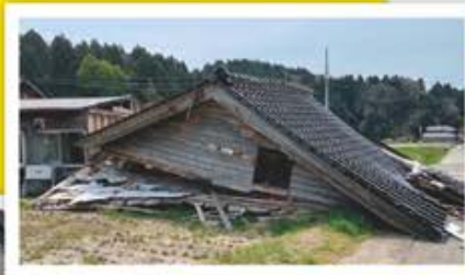
揺れによって 1階部分が潰れた家

本年1月1日に能登半島において地震が発生し多くの方が被害に遭われ、現在も復興作業が続いています。当町においても、南海トラフ地震をはじめとした自然災害による被害が想定されています。これらの被害を最小限にしていくために「自助」、「共助」の取り組みをお願いします。