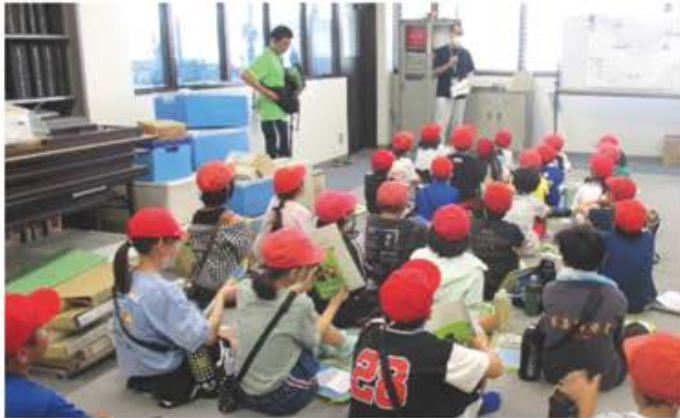
山岡水源地浄水場見学の様子