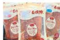
ふるさと味工房アグリ 「玉城豚ポークジャーキー」

松ちゃん堂の生しいたけは、玉城町および近辺のスーパーなどで販売されていますので、見かけた際はぜひお試しください。アグリポークジャーキーは個人的にもよく購入しています。お酒との相性ピッタリです。