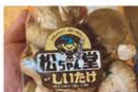
松ちゃん堂 「生しいたけ(菌床)マッシー」

令和3年度に創設した玉城ブランドTaste of Tamakiの第3回認定審査会を実施。書類審査・申請者プレゼンテーションなどの審査を経て、有限会社MCDの「生しいたけ(菌床)マッシー」とふるさと味工房アグリ「玉城豚ポークジャーキー」2件が認定されましたのでご紹介します。