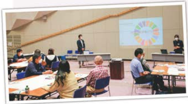
ワークショップの様子(令和4年度実施)

今後は8月までに、田丸駅舎の解体が完了し、9月から新駅舎の建築を進めていきます。工事期間中ご不便をおかけしますが、ご理解ご協力をお願いします。