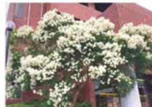
ティーツリー (2022年撮影)