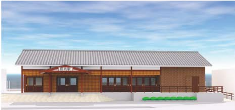
「(仮称)田丸駅交流施設」完成イメージ

町では、田丸駅舎の取壊しに伴い、多様なつながりを創出する交流拠点「(仮称)田丸駅交流施設」として再整備します。利用者や地域のみなさんの意見をもとに、駅舎機能を残しつつ、観光や地域の拠点となる交流施設を目指します。