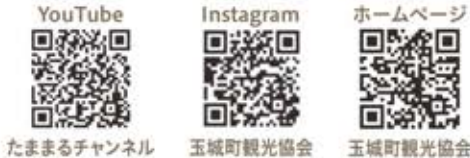
たままるチャンネル 玉城町観光協会 玉城町観光協会