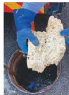
原因は食用油でした