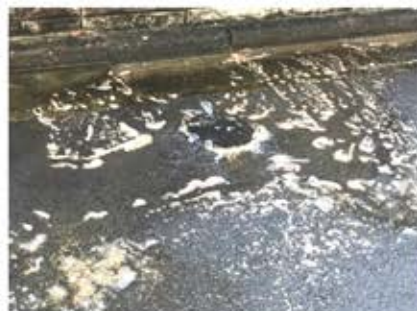
マンホールから汚水があふれ出している様子

害が9件発生しました。中にはマンホールから汚水があふれ出す被害もありました。快適に下水道をご利用いただくため、正しい使用にご協力をお願いします。