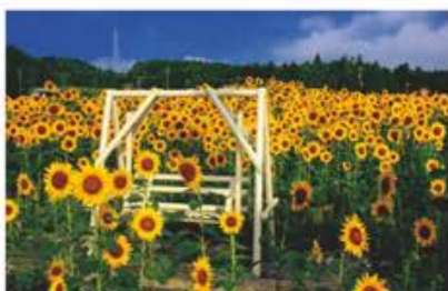
※写真は2021年のものになります。