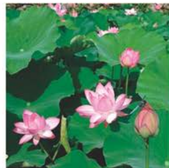
田丸城跡の大賀蓮(2021年撮影)