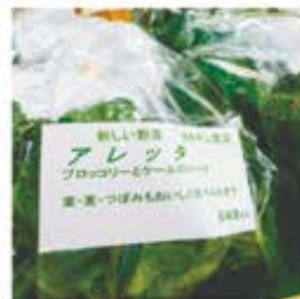
・地元で採れた春野菜「アレック」