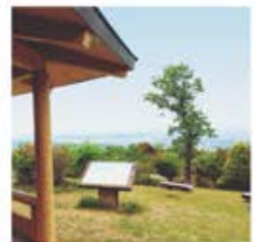
・的山公園山頂からの眺望