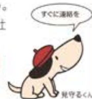
本文イラスト：黒崎 玄