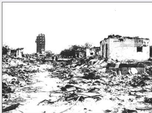
関東大震災の写真

9 月1日は、「防災の日」と定められています。経緯は1923年(大正12年)9月1日午前11時58分頃に発生した関東大震災(被災者490万人、死者・行方不明者10万5,000人、全壊10万9,000棟、全焼21万2,000棟)にちなんだものであり、また、暦の上では、8月31日～9月1日付近は台風の襲来が多いとされる二百十日にあたり「災害への備えを怠らないように」との戒めも込められ、更には1959年(昭和34年)9月26日の「伊勢湾台風」によって、戦後最大の被害(全半壊・流出家屋15万3,893戸、浸水家屋36万3,611戸、死者4,700人、行方不明401人、負傷者3万8,917人)を被ったことが契機となって、1960年(昭和35年)に閣議決定されました。