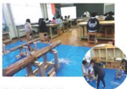
田丸小学校(5年生) (コースターづくり)