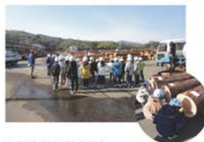
有田小学校(5年生) (ウッドピア松阪工場見学)