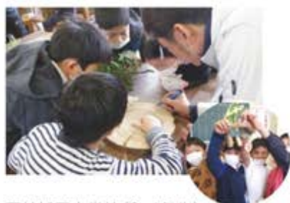
下外城田小学校(3、4年生) (キーホルダーづくり)

児童たちは、各講師のお話に興味深く聞き入り、また木工品製作に精を出していました。