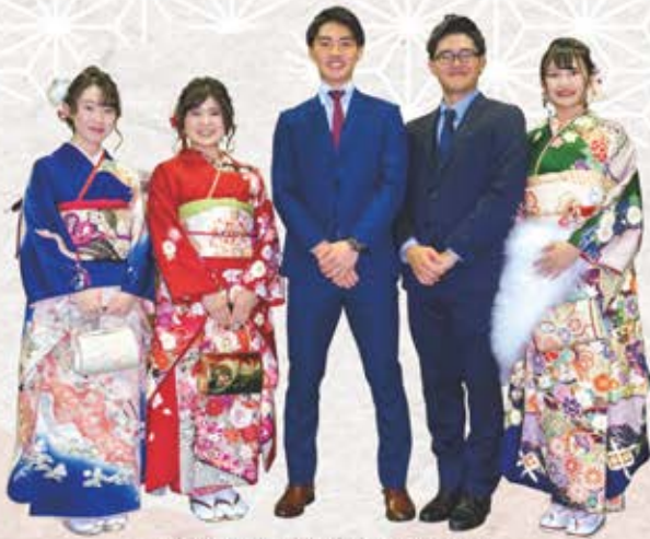
玉城中学校元生徒会のみなさん