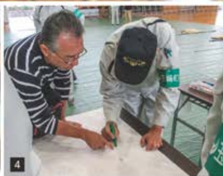
1 全体集合時のようす 2 発電機取扱い訓練 3 災害時役立つ物作りのようす 4 避難経路地図記入