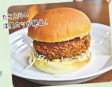
山海荘オリジナルのとばーがー「たこかつバーガー」