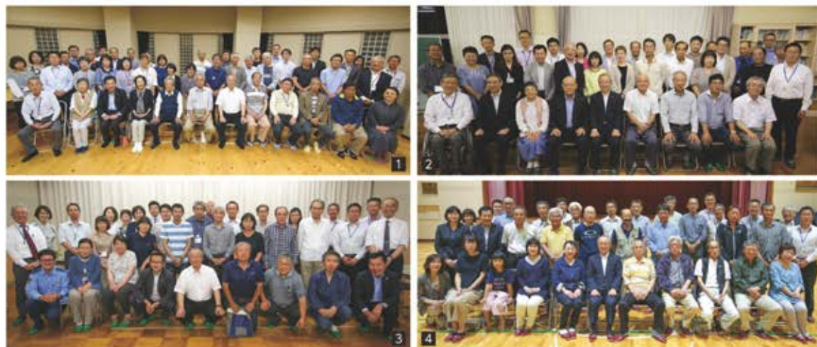
1 田丸地区 2 外城田地区 3 有田地区 4 下外城田地区

人口減少や地域のつながりが希薄化しつつあり、安全で安心な地域社会を形成するために各自治区長をはじめ、102名が参加し、各自治区の地域づくりについて考え、意見交換を行いました。今後、意見交換で出された意見を町の施策に活かしていきます。