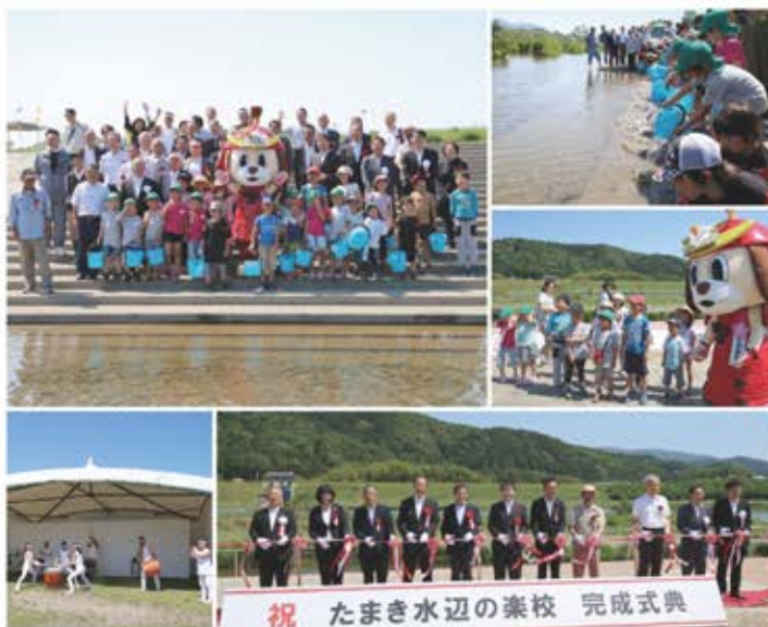
祝 たまき水辺の楽校 完成式典