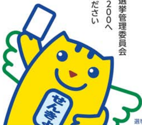
選挙のめいすいくん