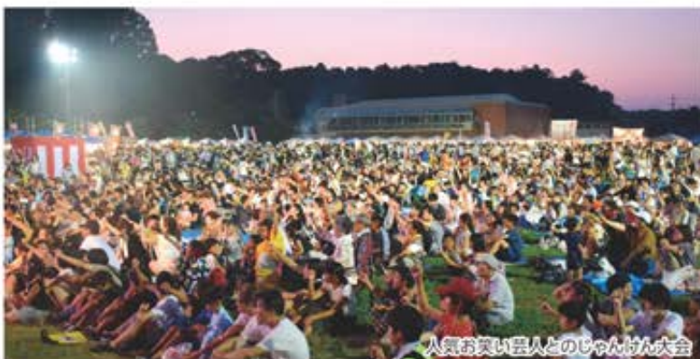
人気お笑い芸人とのじゃんけん大会