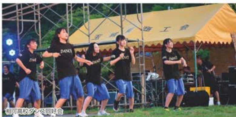
相可高校ダンス同好会