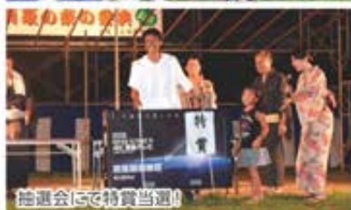
抽選会にて特賞当選!