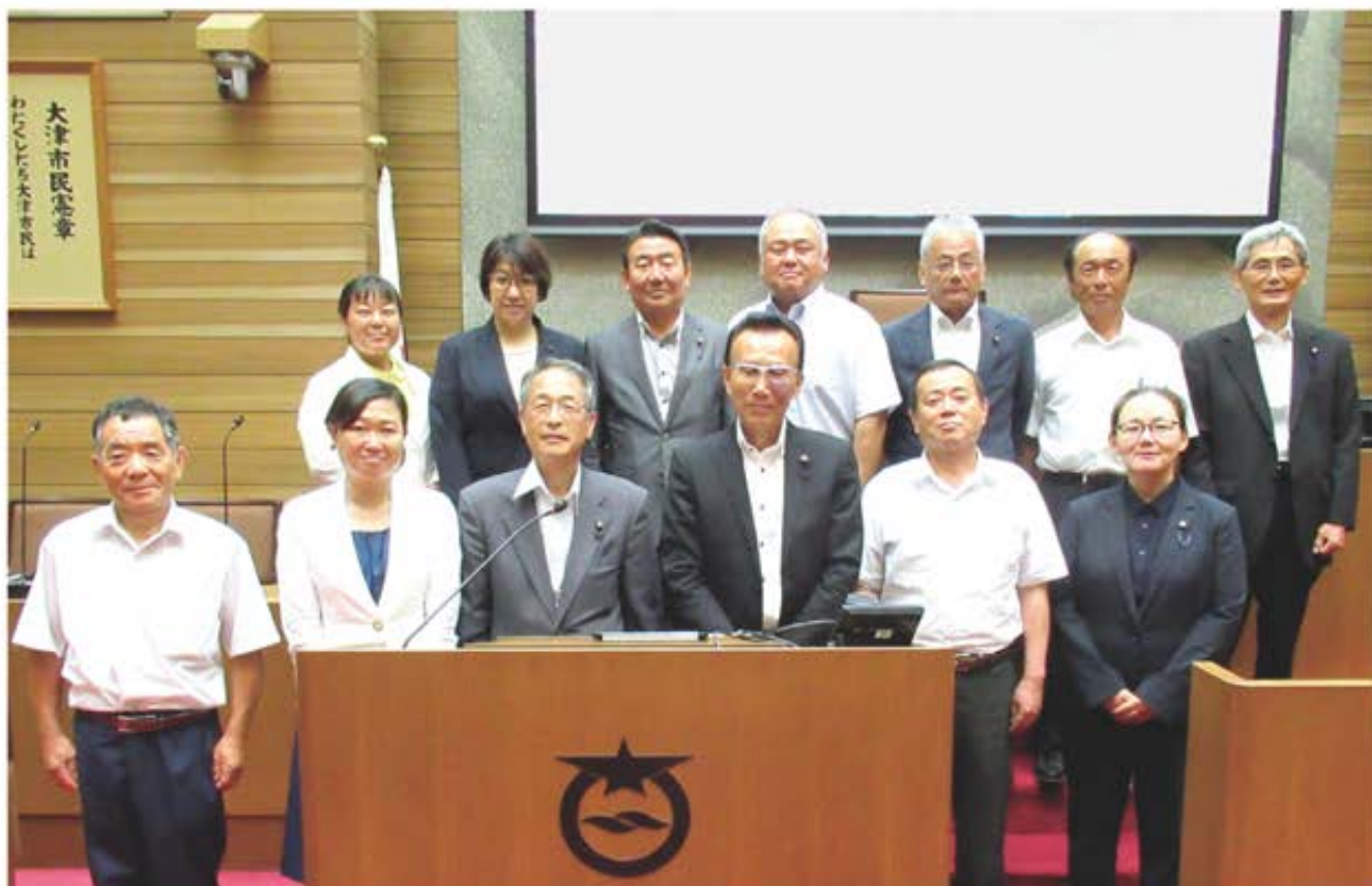
写真は、平成30年7月20日視察 大津市議会にて～BCP(業務継続計画)について～