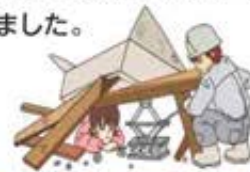
防災訓練に参加しましょう。

「防災の日」が制定されるまでは、9月1日に行われる行事は、関東大震災慰霊祭が中心でしたが、「防災の日」が制定されてからは、全国各地で大規模な総合防災訓練などが行われています。