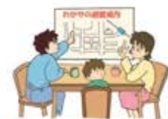
家族で防災について話し合いましょう。