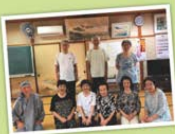
宮古区のみなさん

「誰もが安心して、元気に暮らせるまち ふるさと玉城」を目指して、町では、平成28年4月から元気づくりシステムを導入し、現在22地区で元気づくり会を実施しています。