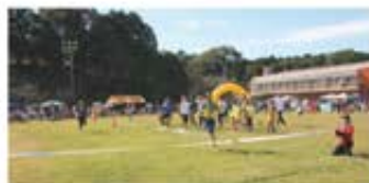
小中PTA対抗リレーのようす