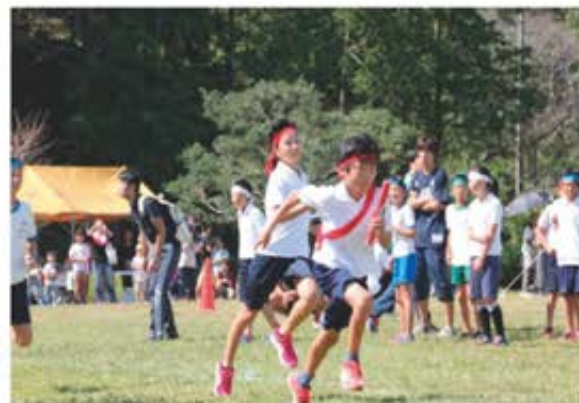
町内小学校対抗リレーのようす