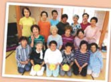
妙法寺区のみなさん