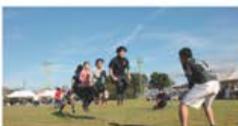
ジャンボなわとびのようす