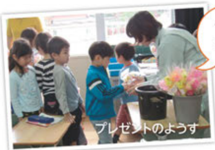
プレゼントのようす