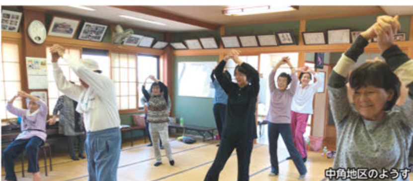
中角地区のようす