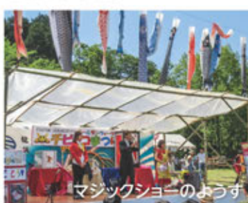
マジックショーのようす