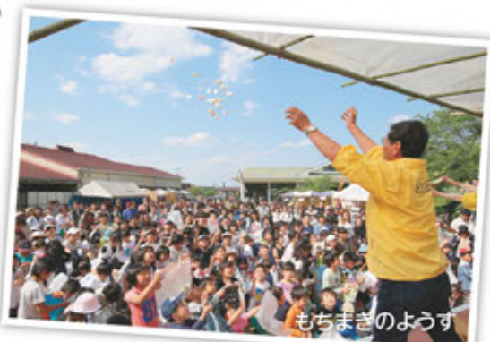
もちまぎのようす

玉城中学校吹奏楽部の演奏会、マジックショーなどのステージイベントや牛乳早飲み大会、紙ひこうき飛ばし大会、じゃんけん大会などのゲームが行われました。子どもたちが奮闘する姿に観客が大きな声援を送り、子どもたちの笑顔いっぱいのもつりとなりました。