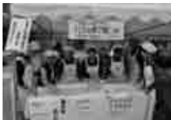
「ハスの実ご飯」試食風景

◆大賀ハスの実を利用して◆ 昨年度は内堀で取れた大賀ハスの実を使ってスイーツを作りましたが、今年は「ハスの実ごはん中華風を作ってみました。 ハスの実は銀杏のような食感や味で、効能は滋養強壮・疲労回復・精神安定・健胃・血圧や血中脂肪を下げる作用などがあります。