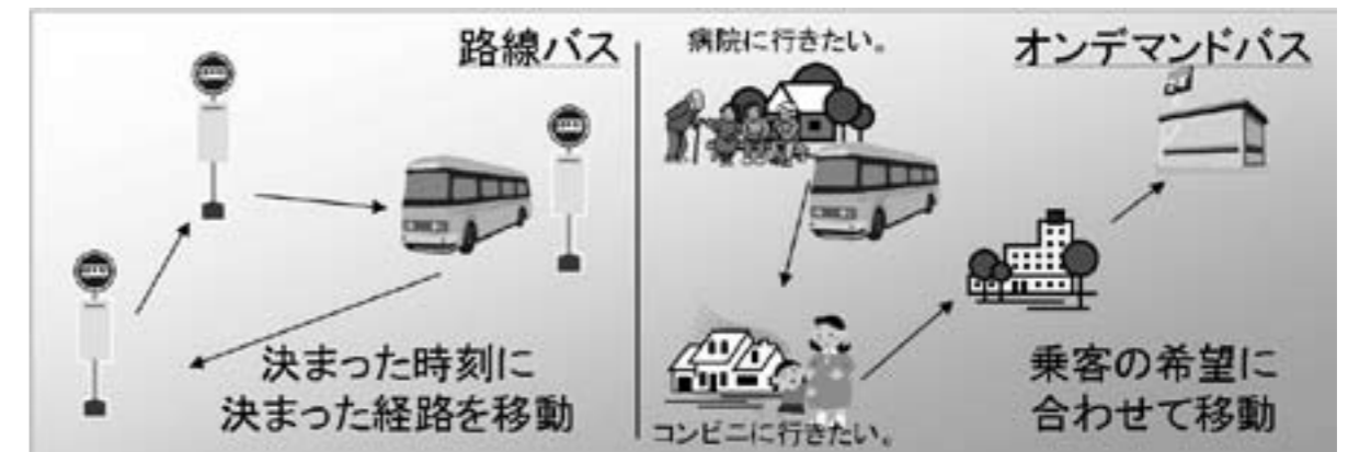
図1. 路線バスとオンデマンドバスの違い