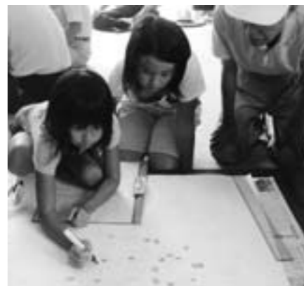
みんなで防災マップ作り

新田町地区学習等供用施設におよそ30人が集まり、2つの班に分かれ、内容やコースの説明を聞き早速タウンウォッチングに出発しました。