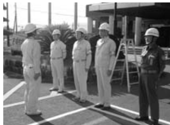
災害対策本部へ人員報告