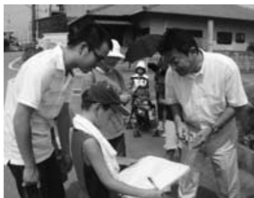
タウンウォッチングの様子

今回のタウンウォッチングは、地震が起きたことを想像しながら、自分たちの地域は自分たちで守るいわゆる『自助』の意識を高めるため地域を観察し、今まで気付かなかった問題を発見することを目的に、民生委員協議会主催、社会福祉協議会・町役場の共催で開催されたもので、町内では初の試みです。