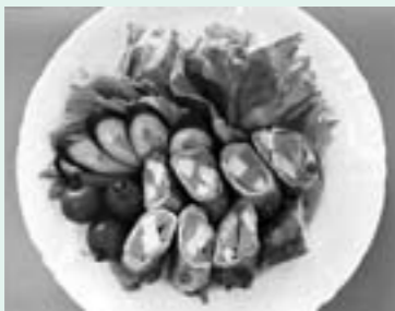
〈まこもの豚肉ロール〉2人分盛り付け例