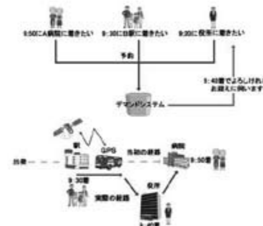
図2. オンデマンドバスのしくみ