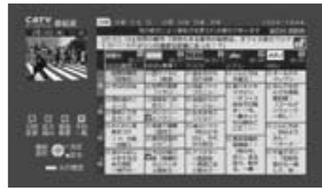
電子番組表 (EPG) 画面例