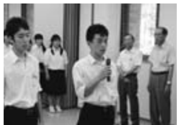
東海大会への抱負を述べる選手ら

7月上旬から伊勢度会地区予選が始まり、各競技で熱戦が繰り広げられたなか、剣道部(男女)、ソフトボール部、バドミントン部(男女)が県大会へ出場し、剣道部男子(団体)、バドミントン部男子(個人)が東海大会への切符を手に入れました。