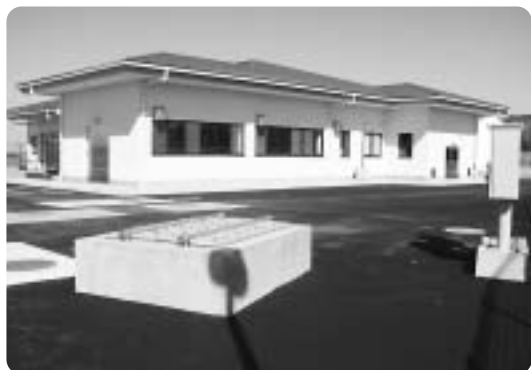
あたらしく井戸が掘られ整備された山岡水源地

新し、あわせて山神地区へ500立方メートル貯水できる新配水池の設置をしたもので、総事業費はおよそ8億8千万円。