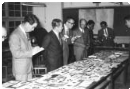
昭和40年 町章選定審査会の風景