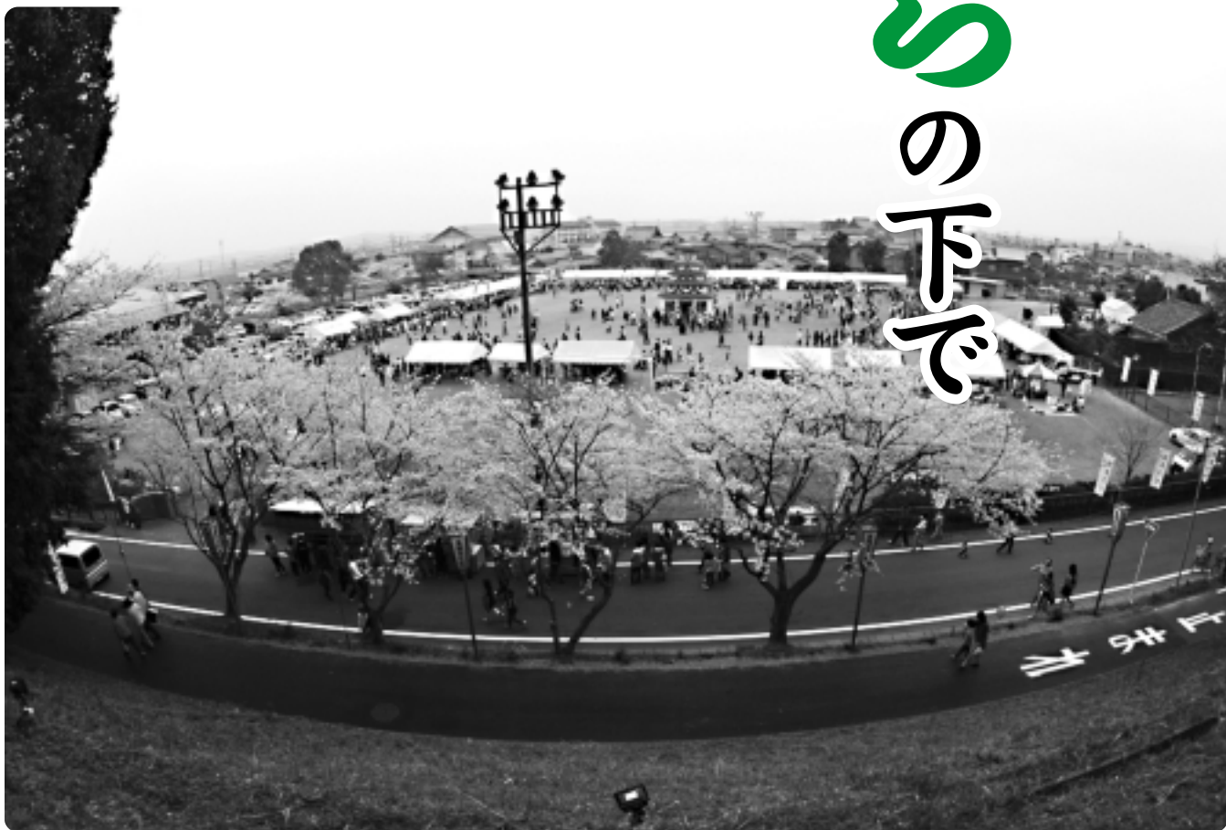
会場の中央には、お城の形をした遊具が建てられ、ひとの目を引きつけていました