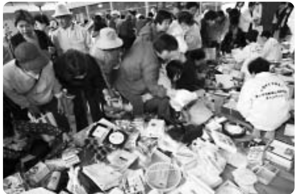
お気に入りの物を買って求めて チャリティバザーにはたくさんの方が集まりました