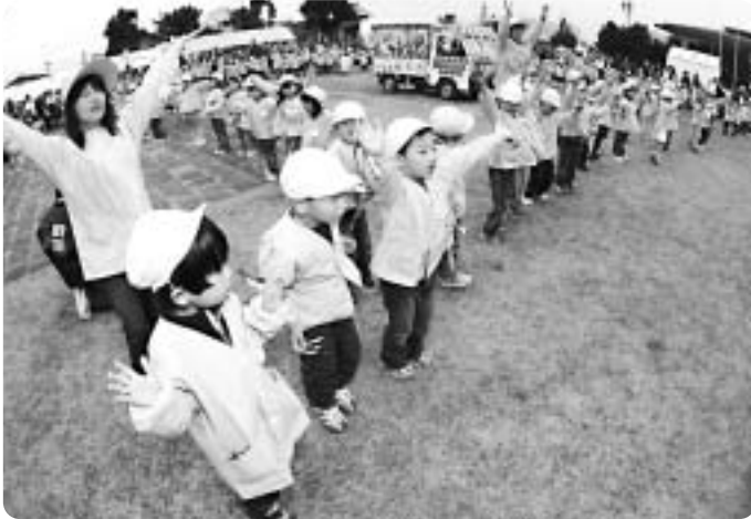
保育所園児も元気いっぱい踊っていました