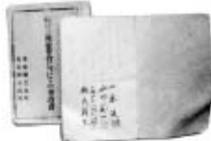
昭和30年 玉城町誕生にむけの 申請書(下)