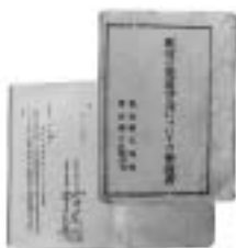
昭和31年 下外城田村編入 申請(上)