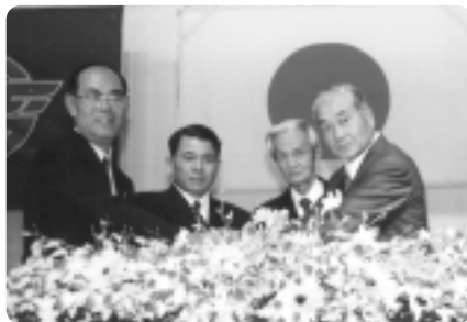
平成5年 玉城村姉妹提携調印式