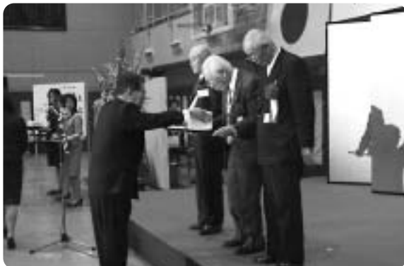
功労者一人ずつに感謝状と記念品を贈りました