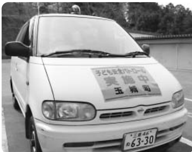
青色回転灯とパトロール実施中のシールを貼り警戒にあたります

これまでも、町内では下校中の小中学生を不審者が車に乗るよう誘うなどの声掛け事件が発生しており、犯罪防止の抑止効果に期待が寄せられています。