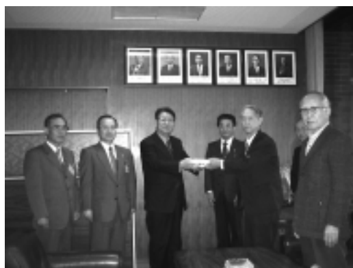
発刊を中瀬町長に報告する編さん委員のみなさん