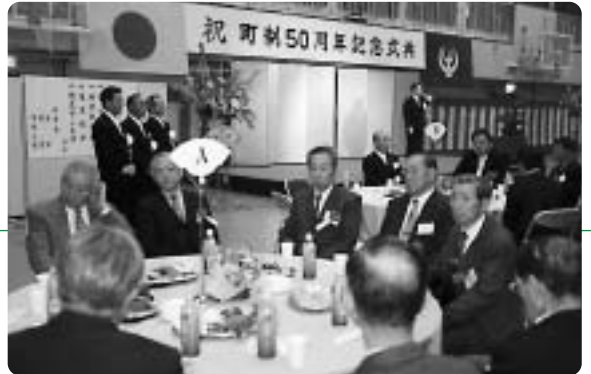
町長はじめ町3役がみなさんをお迎えました