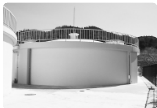
2つ目のタンクが完成した山神配水池

日常生活に欠かすことのできない水。町で上水道事業が始まったのは1975年（昭和50年）。30年が経過し、安定供給と防災対策を目的に、平成14年度から3年計画で施設の改修事業を行い、このほどすべての事業が終了しました。