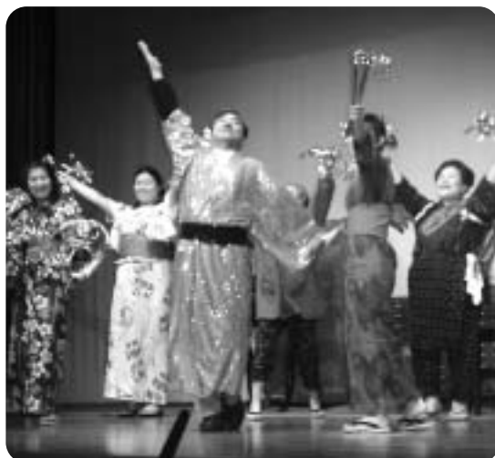
情熱みなぎる演技で会場をわかせた

回目の生誕の日にあたり、午前には恒例の生誕祭も行われ、終日、翁の在りし日をしのびました。