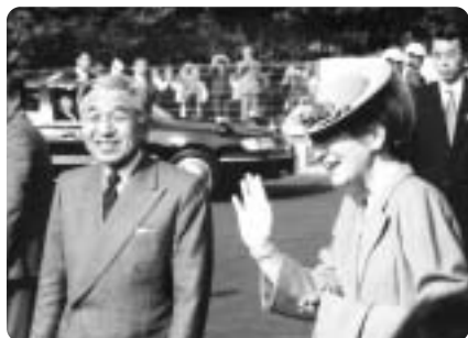
平成13年 天皇后両陛下御来町 (わかば学園)