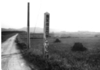
昭和36年 勝田パイロット地区

咲き誇る田丸城跡の桜は、昭和30年4月の玉城町誕生の春と変わることはありません。しかし、天守跡から一望する町の景色はその様変わりに感動してしまいます。 50年前は、戦後の混乱を克服し、高度経済成長に向かった頃で、当時のくらしを変えた「生活革新」の時代とも言われました。 家庭では、テレビや電気冷蔵庫庫、電気洗濯機、電気炊飯器が次々に登場し、まちでは自転車からバイク、自動車へと交通手段も変わりました。 そのようなときに、町内の南に目をやれば、東西に走る伊勢自動車道が整備され、自然環境にとけ込むように工場が進出し、田園を貫くサニードと目を見張るものが数