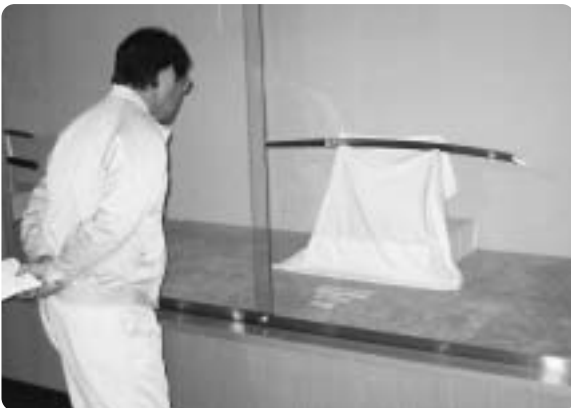
「郷土刀」展示期間中にたくさんの方が会場を訪れました