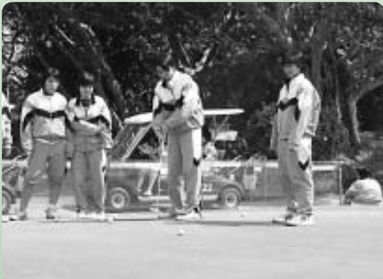
パットニングを体験する生徒たち

パットニングを体験する場所も設置され、生徒たちはスタッフからアドバイスを受けながら、選手のまねをしたり、勝負をしたりして楽しんでいました。