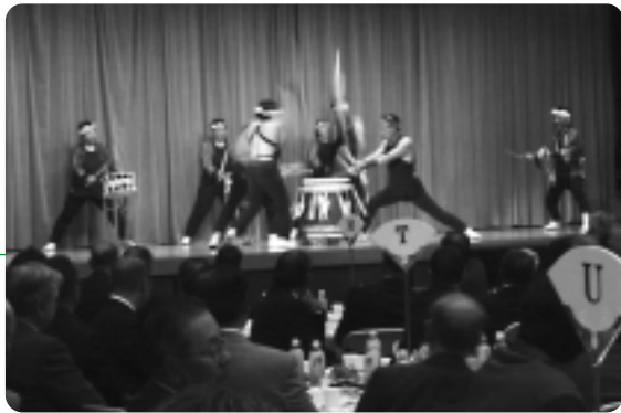
田丸城太鼓保存会がお祝に「もちつき太鼓」を披露