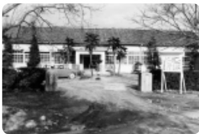
昭和31年 玉城病院誕生