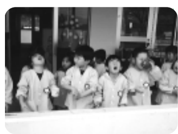
進級を迎える事ができました。

おかげで感染力の強いインフルエンザの罹患(りかん)率も低く、子ども達は修了・進級を迎える事ができました。