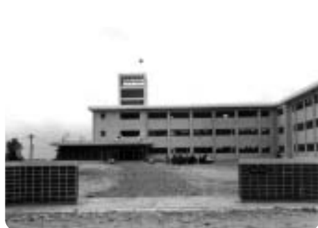
昭和39年 玉城中学校校舎完成