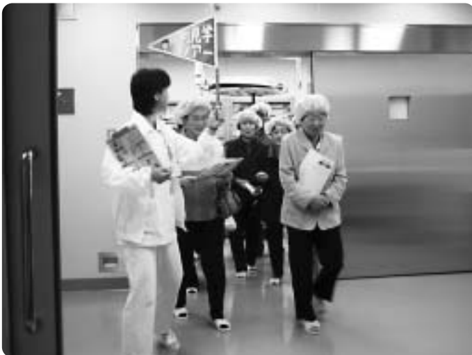
「病院老健まつり」では手術室も見学できるツアーに人気があった