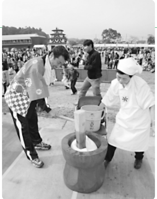
ステージではみんなが参加できる餅つきが行われました