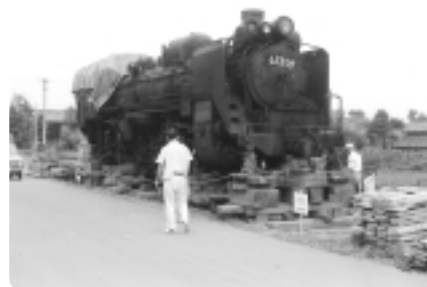
昭和48年 台車で移送を待つ蒸気機関車(羽根)