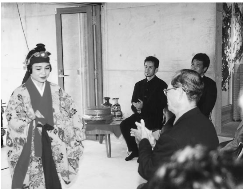
関係者が集いにぎわった亜門家

コーヒーのコマーシャルで馴染み深い演出家で映画監督の宮本亜門（あもん）氏が、玉城村新原区内に住居を新築し4月4日、お祝いをしました。この日は、知念信夫村長をはじめ多くの友人や芸能関係者が招待され、沖縄式の神事で厄をはらった後、祝賀会が行われ、そのなかで亜門氏は「みなさまの協力で家が完成しました。地域の一員として村に貢献したい」と抱負を話していました。新居には、愛犬ピートと同居中とか。