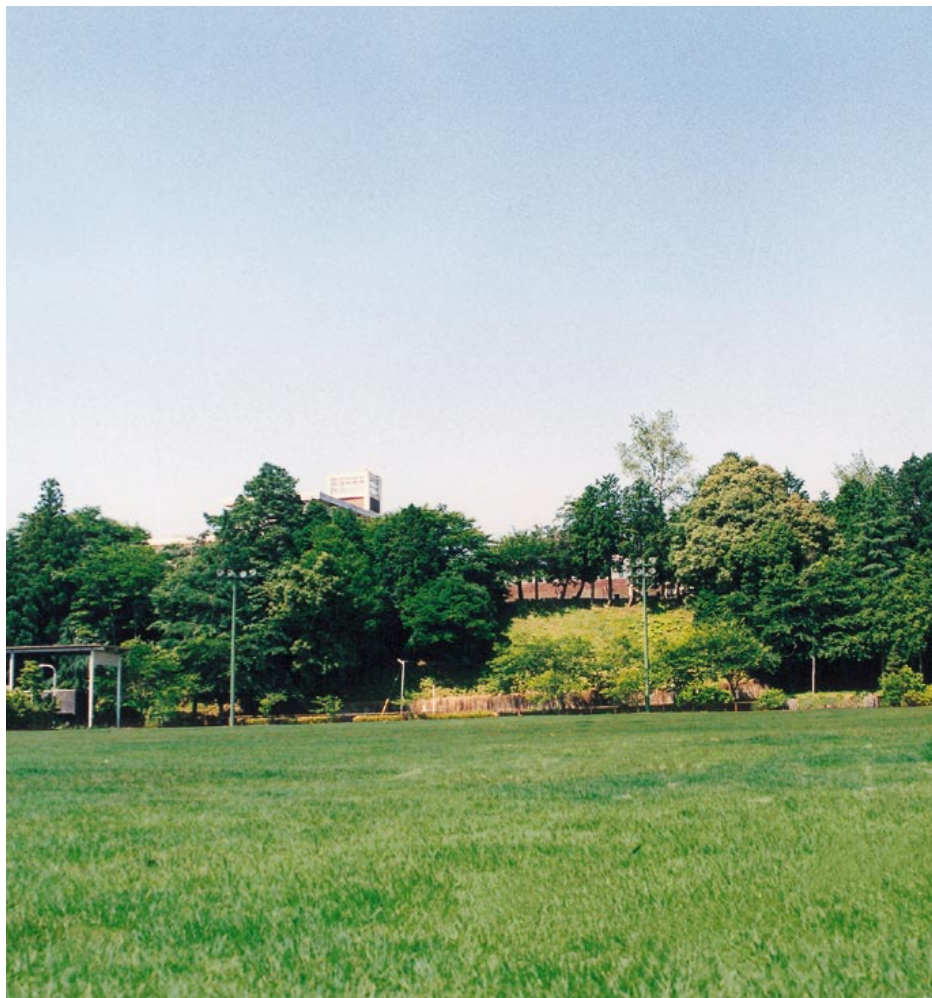
一面に芝生がはえそろう旧田丸小学校グラウンド