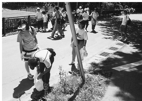
ごみ拾いをしてくれた生徒たち田丸城跡で