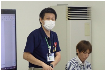
開会挨拶(玉城町建設課)