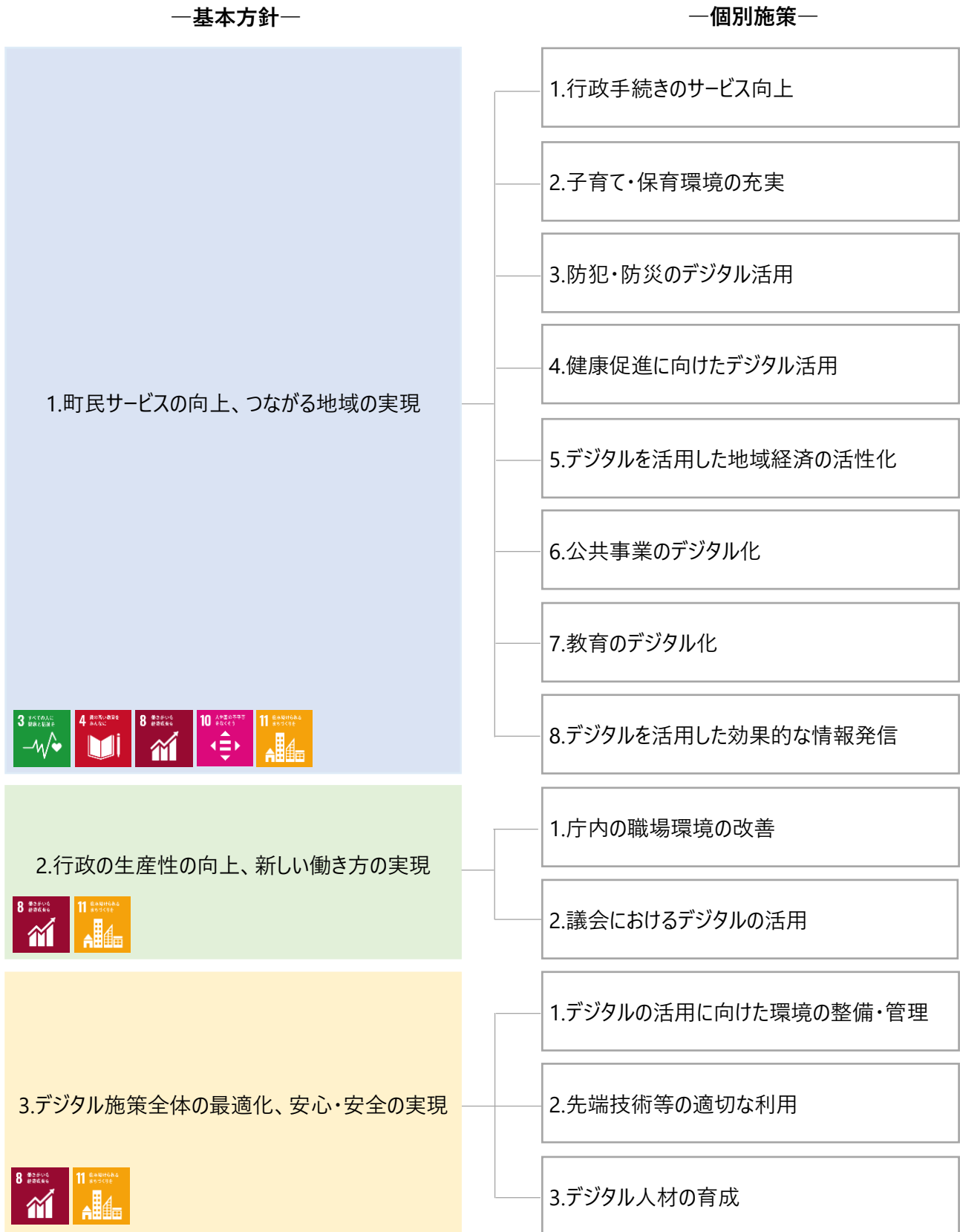
【基本方針に基づくデジタル施策の構成図】