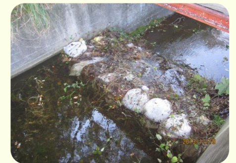
土のうによる洪水吐のかさ上げ

洪水吐に堆積した土砂やゴミ等は、流水断面を阻害し、適切な機能を発揮することができません。また、ため池の貯水を増やすために、洪水吐に土のうを積む様子がよく見られますが、これも危険ですので止めてください。