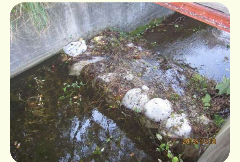
土のうによる洪水吐のかさ上げ

洪水吐に堆積した土砂やゴミ等は、流水断面を阻害し、適切な機能を発揮することができません。また、ため池の貯水を増やすために、洪水吐に土のうを積む様子がよく見られますが、これも危険ですので止めてください。