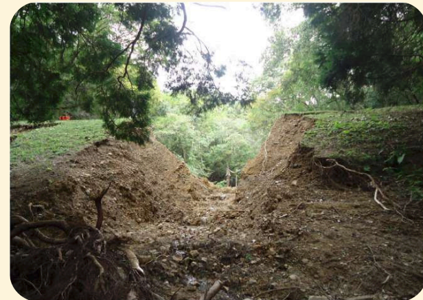
平成25年9月、台風18号による大雨により決壊したため池

ため池は全国におよそ21万箇所あり、古くから農業用水の貯水池として利用されてきましたが、その多くは築造から100年以上が経過し、老朽化が進行しています。さらに、近年多発している局地的な大雨や地震などの自然災害が重なることにより、ため池が決壊し、人命や財産などに大きな被害をもたらす危険性が高まります。