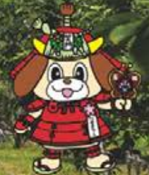
玉城町イメージキャラクター たままるくん