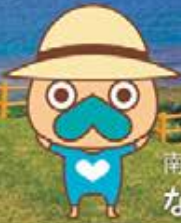
南城市イメージキャラクター なんじい