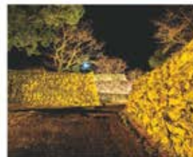
田丸城跡ライトアップ (2022年撮影)