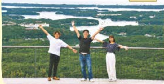
〒志摩市阿児町鶴方875-20 ☎ 年中無休