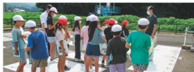
三郷・昼田処理場見学の様子