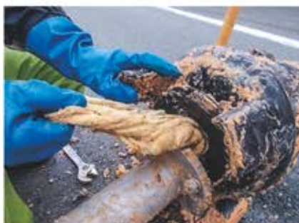
マンホールポンプにタオルが詰まっている様子

町の下水道に流せるのは、台所・洗濯・お風呂・トイレ等からの排水で、雨水は流せません。また、ティッシュペーパーや食用油を流してしまうと、排水が詰まり逆流する恐れがあるので絶対に流さないでください。昨年度は異物の混入により下水道管が閉塞したり、ポンプが故障する被害が4件発生しました。快適に下水道をご利用いただくため、正しい使用にご協力をお願いします。