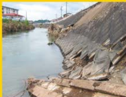
平成29年台風第21号による被害