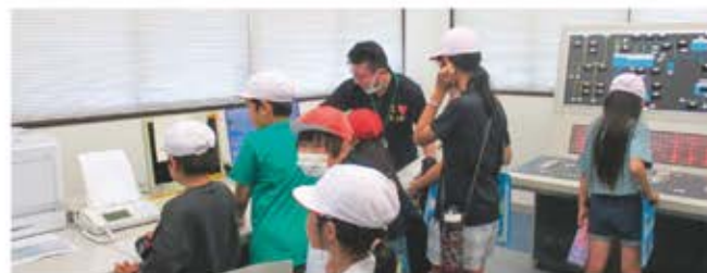
山岡水源地浄水場見学の様子