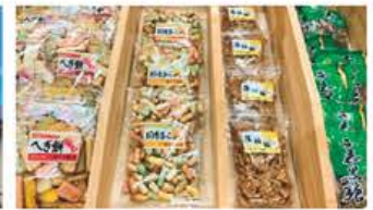
田舎あられやへぎ餅など