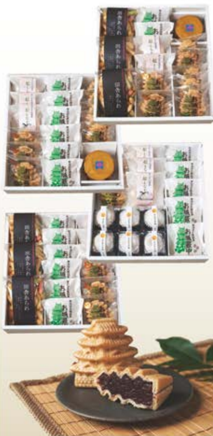
勢州田丸城銘菓 お城最中(玉花 吉祥庵)