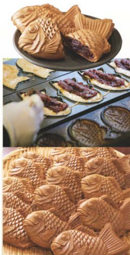
わらしべ本店の たいやき