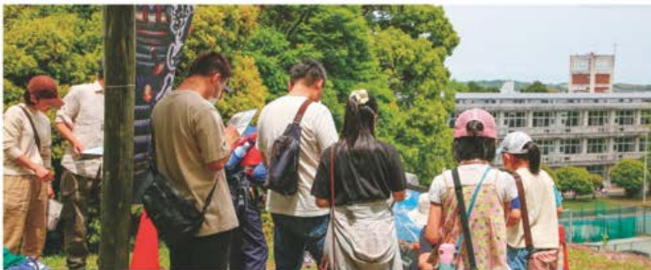
田丸地域(まち歩き謎解き)