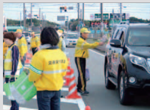
キャンペーン活動のようす