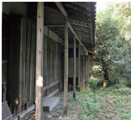
町指定文化財・玄甲舎

茶室と庭先の草木が醸し出す独特の雰囲気でも過ごすひとは、「歴史と文化の町」としての醍醐味が味わえる唯一の施設です。町では修繕・保存・管理に取り組み、みなさんに町の歴史文化を感じていただくよう有効に活用していきます。