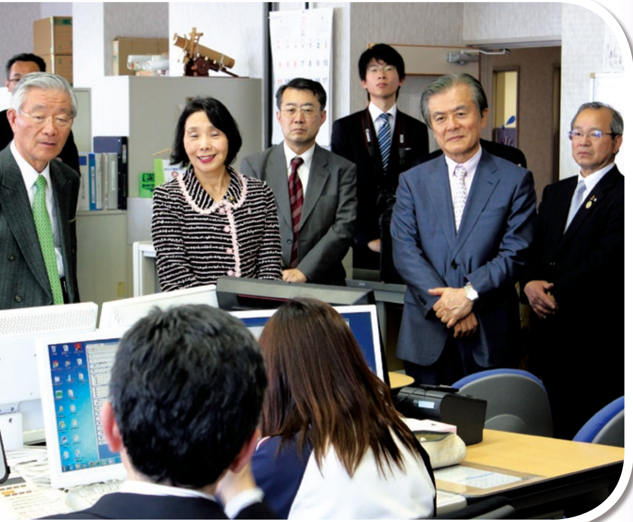
写真：「ICT街づくり推進会議」実証プロジェクト現地視察のようす（詳細はP5）