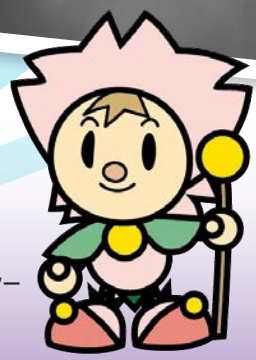
玉城町マスコットキャラクター タム 「玉夢くん」