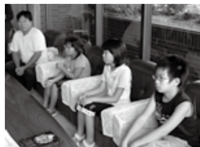
大会の結果を報告する選手ら

たし、8月1・2日に日本棋院市ヶ谷会館(東京)で行われた第7回文部科学大臣杯小・中学校囲碁団体戦(財団法人日本棋院主催・参加64校)に出場しました。予選リーグを3戦全勝し、