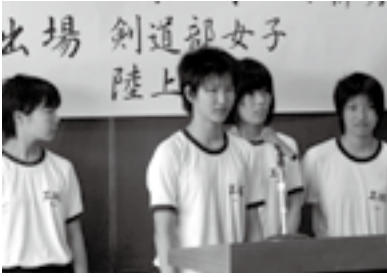
東海大会への抱負を伝える選手ら

その結果を受けて、8月4日に中央公民館で激励会があり、東海大会に出場する選手らが抱負・目標を町長らに伝えました。また7月25日