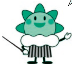
気象庁マスコットキャラクター 「はれるん」

大雨などの警報・注意報 を市町ごとに発表します。 平成22年5月27日開始 予定