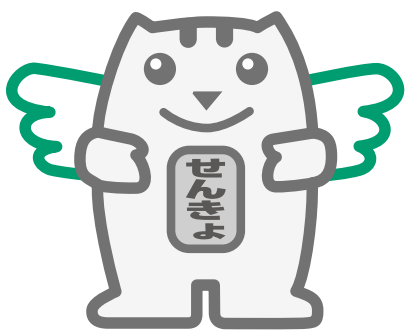
明るい選挙キャラクター「選挙のめいすいくん」