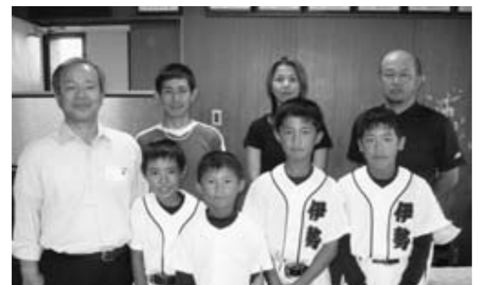
全国大会の健闘を誓う選手のみなさん