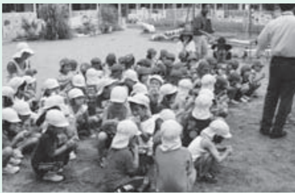
空芯菜入りクッキーを試食する園児ら