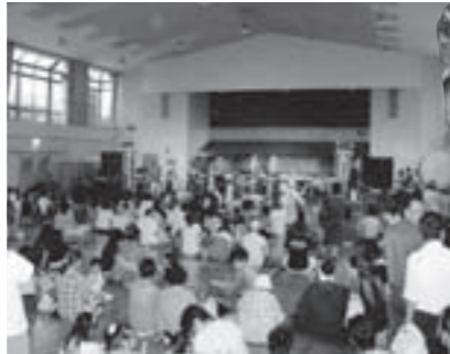
ステージイベント (屋内体育館) の様子