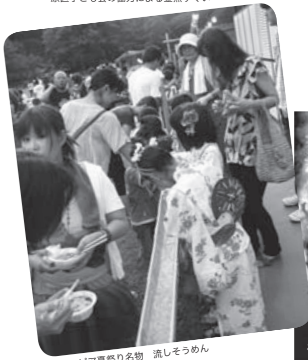
アスピア夏祭り名物 流しそうめん