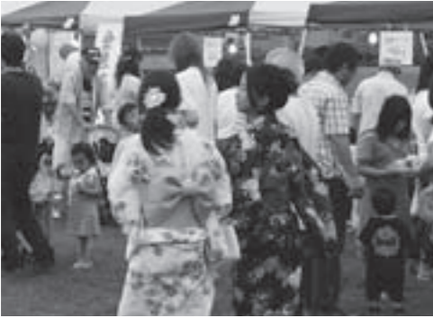
約500人が浴衣姿で来場