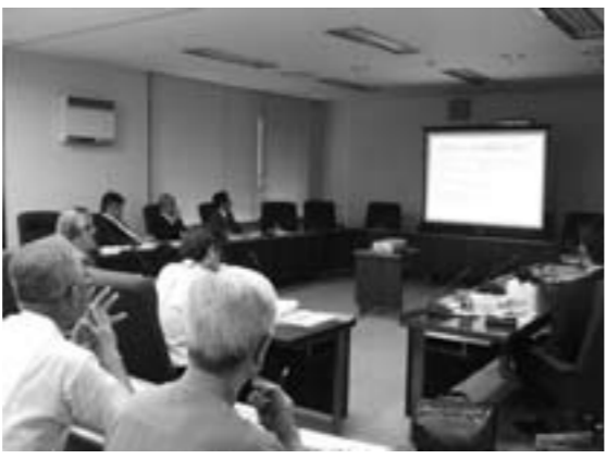
美し国おこし・三重県議会視察の様子

いち早く座談会が行われた町へ県議会政策総務委員会のみなさんが訪れ、その座談会から生まれたパートナーグループ『*1参宮ブランド「擬革紙」の会』『*2里山菜食塾「しえあわせ」』から現在の活動、今後の取り組みなどの発表がありました。