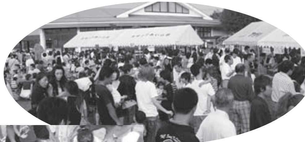
1,000人を超える人でにぎわったアスピア玉城