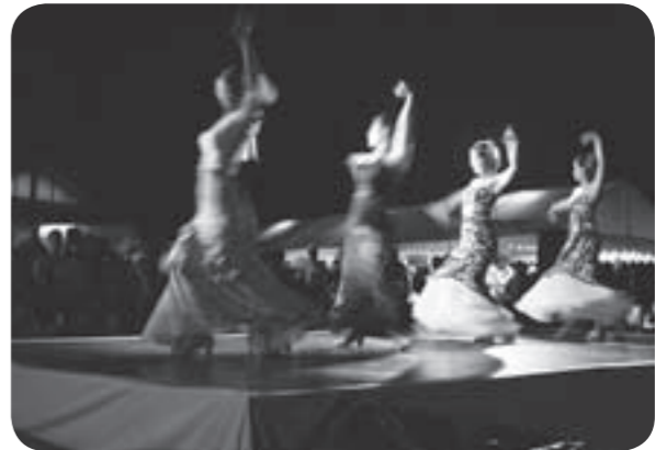
エキゾチックさ漂う「フラメンコ」ショー