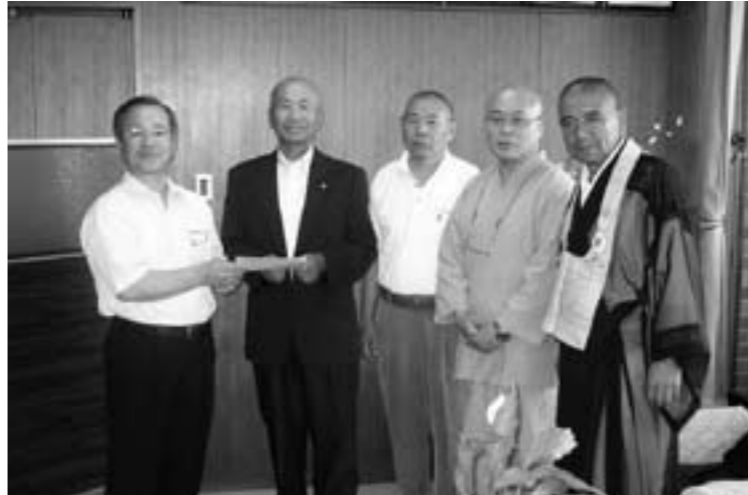
辻村町長にメッセージを伝達する保護司のみなさん

7月1日『更生保護の日』に、玉城町保護司のみなさんが、パンフレットを田丸駅前配り、社会を明るくする運動への啓発と理解を求めました。