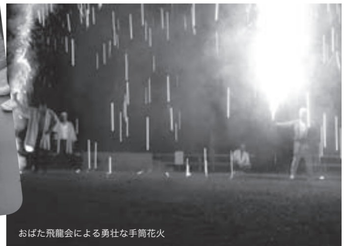
おばた飛龍会による勇壮な手筒花火