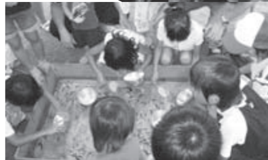
原区子ども会の協力による金魚すくい