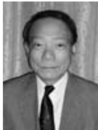
〈講師プロフィール〉