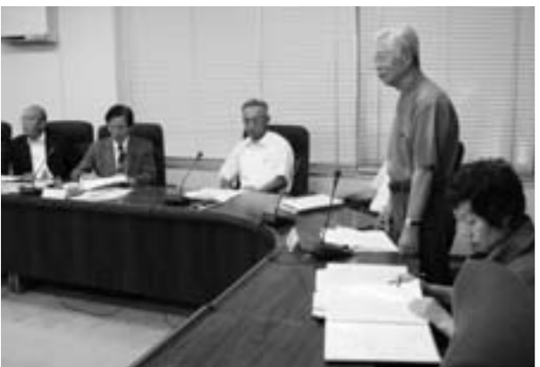
活動の報告をする参宮ブランド「擬革紙」の会

いち早く座談会が行われた町へ県議会政策総務委員会のみなさんが訪れ、その座談会から生まれたパートナーグループ『*1参宮ブランド「擬革紙」の会』『*2里山菜食塾「しえあわせ」』から現在の活動、今後の取り組みなどの発表がありました。