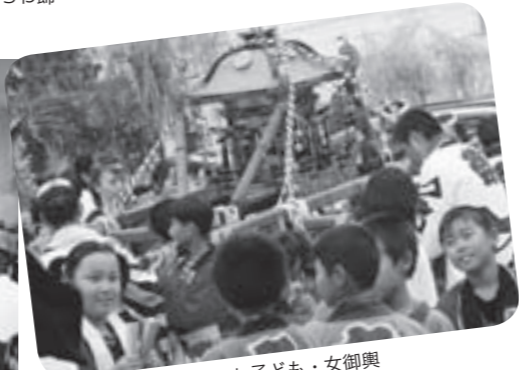
会場周辺を練り歩いた子ども・女御輿