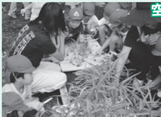
空芯菜を収穫する田丸保育所年長組

保育所の園庭に集まった園児たちは、高校生のお兄さんお姉さんの説明をしっかりと聞き30cm程度に成長した400