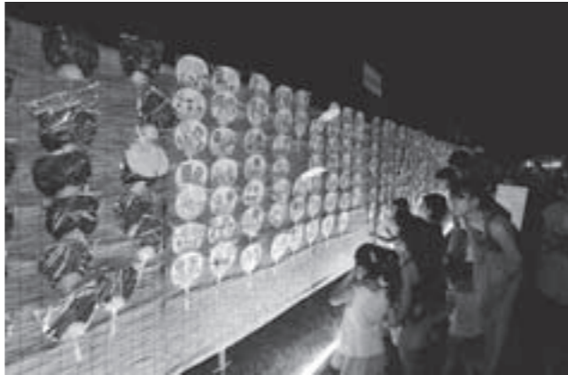
涼しげなうちわ飾

フィナーレを飾ったミニスターマイン、30mのナイアガラ花火の迫力にみなさん大満足の様子でした。