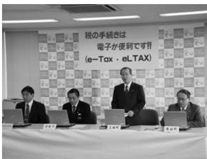
届書の送信を行う玉城町長

国税の電子申告ができる「イータックス（e-TAX）」の地方版で、事業所が市町村に報告する給与支払報告書の送信、法人住民税、固定資産税（償却資産）の申告ができるもので、全国各自治体が導入を進めているものです。