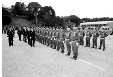
通常点検をうける団員

式では、通常点検、来賓祝辞があり、辻村町長は「災害はいつ発生するかわからない。安全安心のためにさらに防災力を高め、ますます消防団に期待している。」と訓示し、団員を激励。その後、優良