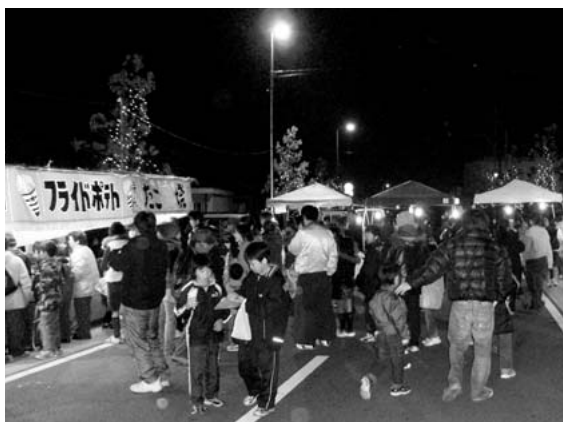
にぎわうJR田丸駅前

すっかり暗くなった午後5時に玉城中学校吹奏楽部の演奏で始まったイベントは、保育園児が作った紙コップ製の「とうろう」点灯でさらに明るさを増し、田丸神社御木曳奉曳団の木遣りや、よさこ