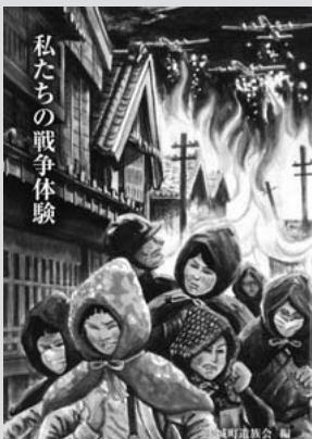
私たちの戦争体験

その年代を生き抜いた町民の実体験を、1年がかりでまとめ上げたもので、様々な苦難の声が記されています。A5版・253ページで百名余りの体験文が掲載されています(購入価格…二冊500円)。購読を希望される方は社会福祉協議会(TEL58-6915)へお問合せください。