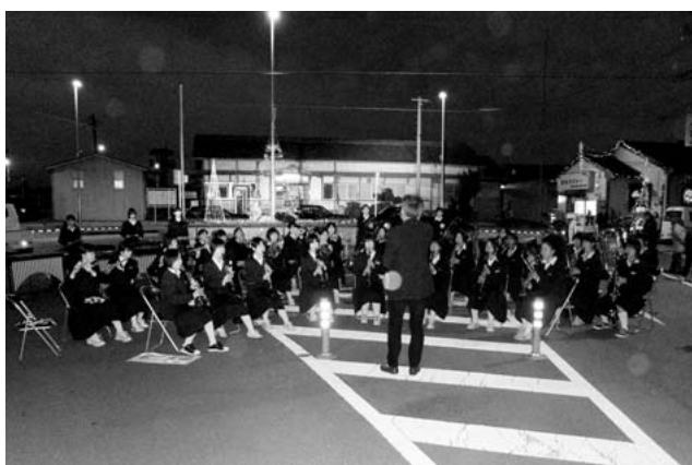
オープニングを飾る玉中吹奏楽部