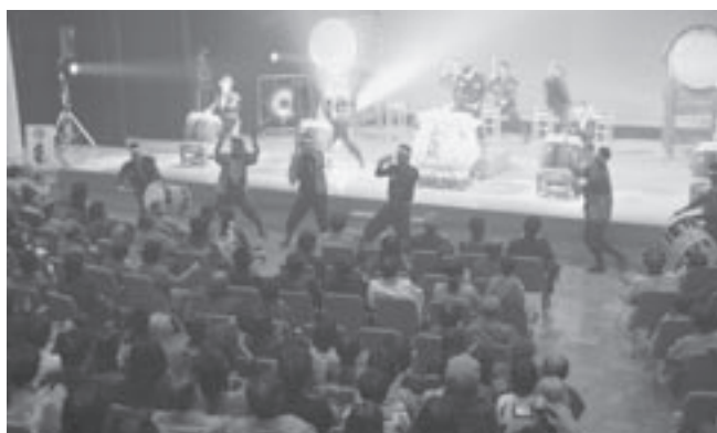
盛り上がりを見せる会場

会員らは喜びや悲しみをバチに込め、力強く太鼓を響かせ、演奏の盛り上がりには満員の会場から歓声と拍手が贈られました。