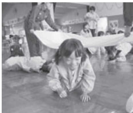
シーツを煙に見立て、逃げ方を教わる子どもたち

今年には『火は見てる あなたが離れる その時を』を全国統一防火標語に、万が一に備えて、消火器や水バケツの準備をしておくことや燃えやすいものを家の周りに置かないなど、火災予防の呼びかけを行いました。防火週間に先駆けて5日には