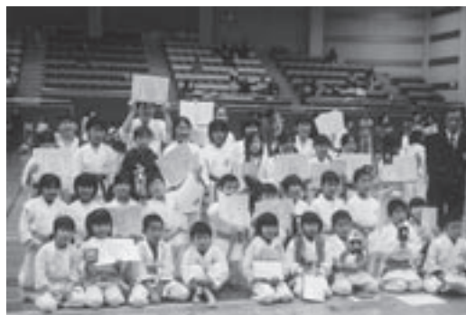
大会に出場した選手のみなさんと指導者

11月25日、明和町総合体育館で第3回南勢地区空手道スポーツ少年大会が開かれ、玉城町をはじめ近隣の小学生・中学生80人を超える選手が出場し、熱戦を繰り広げました。