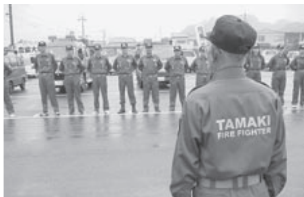
整列する消防団員に訓示を行う舌古団長

11月9日から15日まで秋季火災予防運動が全国的に行われました。この期間中、玉城町でも10日、消防団による町内巡回パレードで火災予防の啓発を行いました。