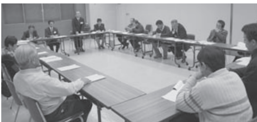
お城サポート会議の様子

お城サポート会議では今回呼びかけた団体以外の取組みも歓迎いたしますので、教育委員会（58）8212までご連絡ください。