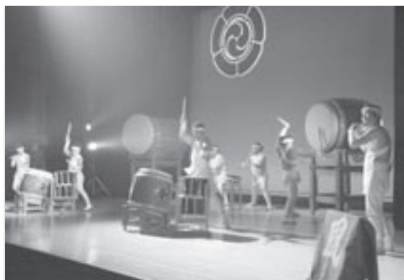
力強い太鼓の響き

ふるさと玉城に誇れる芸能を作りたい。そんな想いから玉丸城太鼓保存会が発足したのが平成3年。本年16年目を迎えた保存会のみなさんが11月18日、いせトピアで『原点を見つめて新たな挑戦』をテーマに記念公演が開催されました。