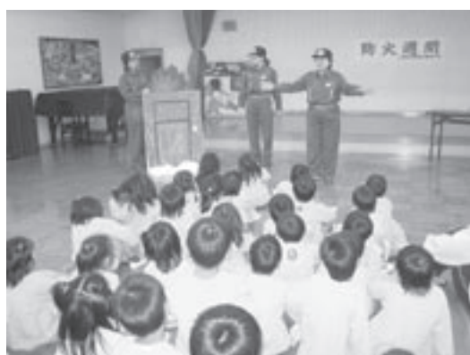
団員手作りの小道具を前にしての『防災教室』

11月9日から15日まで秋季火災予防運動が全国的に行われました。この期間中、玉城町でも10日、消防団による町内巡回パレードで火災予防の啓発を行いました。