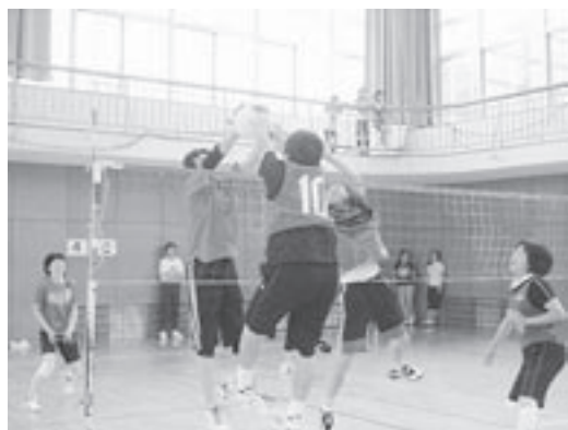
熱戦に汗をながす会員

ソフトバレーは、直径30センチほどの柔らかいボールを使い、1チーム4人編成で対戦するものです。