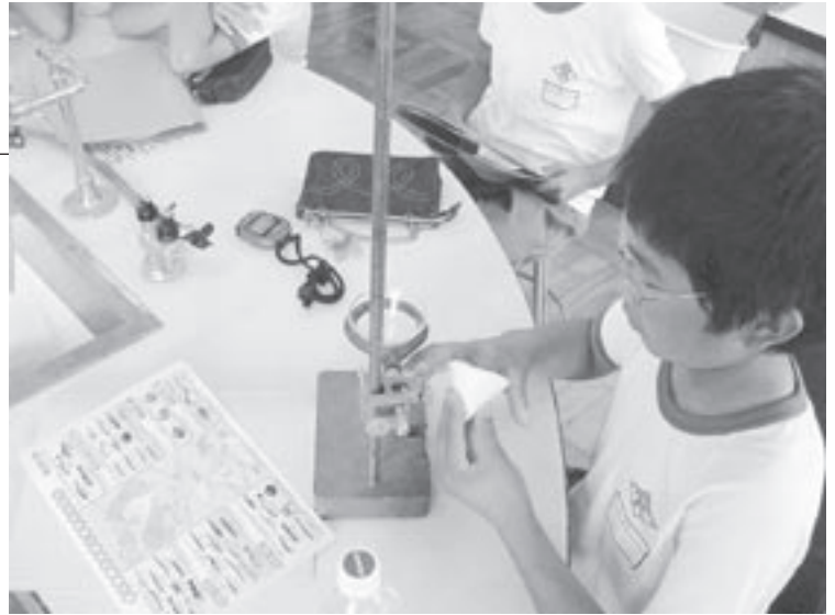
外城田川の水質調査のようす

29日には玉城中学校生徒会が相可高校（生産経済科）とともに、水耕栽培するため田丸城社の内堀に空芯菜（ヒルガオ科・熱帯植物）を植栽。