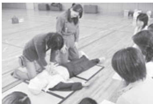
女性消防団員の指導で訓練する保護者ら