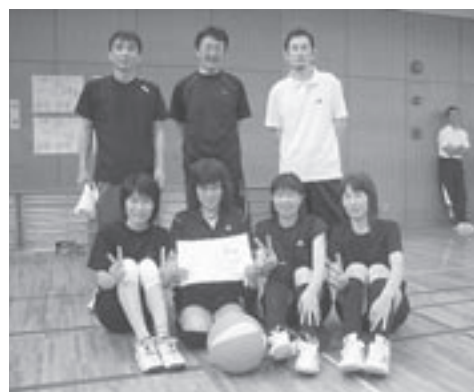
優勝の中学校Aチーム

会員のなかには「気持ちには若い、体がついて行かない」と嘆いていた方もいましたが、皆さん一生懸命試合に挑み、すがすがしい汗を流していました。