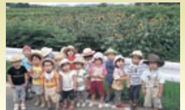
【表・裏】外城田保育所の園児たち （蚊野のひまわり畑）

元気よく育ったひまわり を見上げる子供たち。 夏本番！ひまわりの様にた くさん陽を浴びて、たくま しく育ってくださいね。