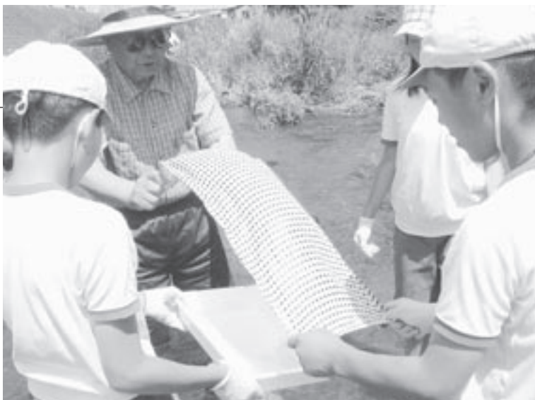
日本手ぬぐいを使い水生生物を捕える児童