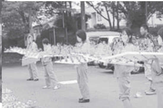
植栽の準備をする相可高校生徒