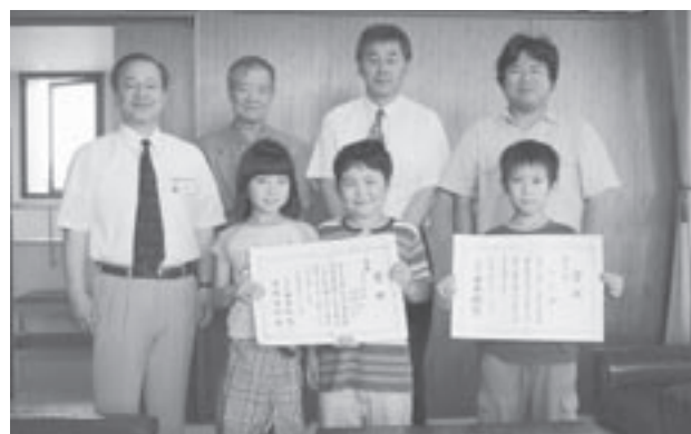
表彰状を手に町長を訪れた中井くん(右)北村くん(中)見並さん(左)