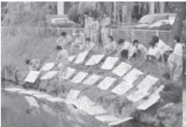
相可高校生といっしょに内堀へ植栽する玉城中学校生徒