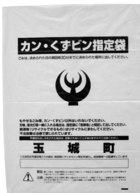
廃止される指定袋