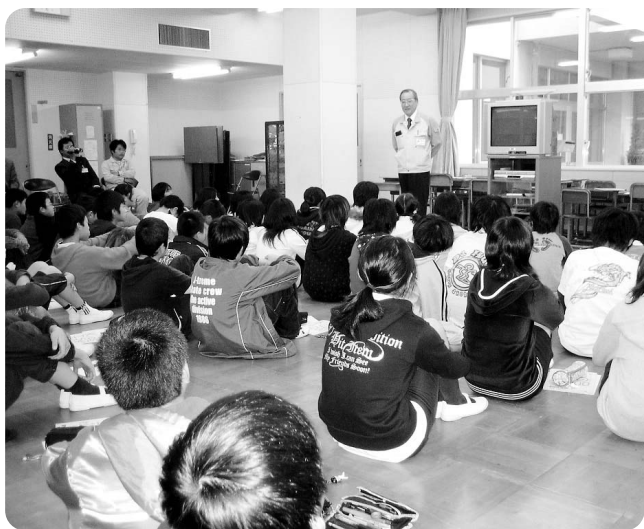
京セラミタ株森北さんの説明をきく児童

6年生は文化祭でも環境をテーマにしたことがあり、メモを取る姿にも真剣さがうかがえました。