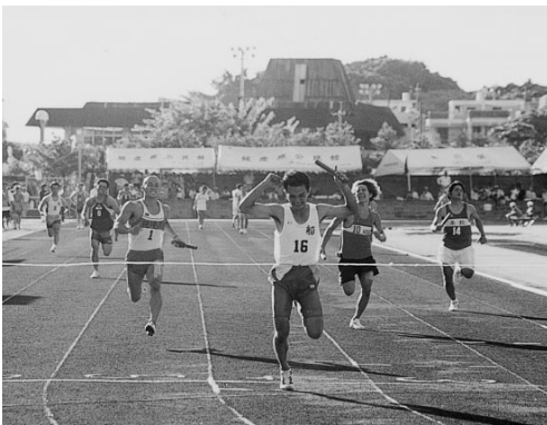
苦しいけど、うれしいガッツポーズ

総合優勝は字系数が手にし、大会が終わった後もカチャーシー（おどり）で盛り上がっていました。