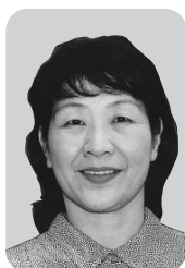
⑫ 鈴木加奈子 (60) 日本共産党 現 7回 長更