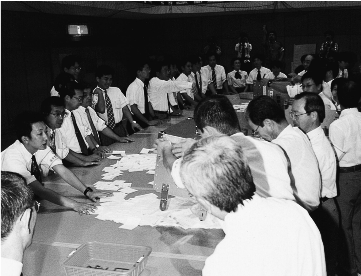
開票風景（玉城勤労者体育センター）