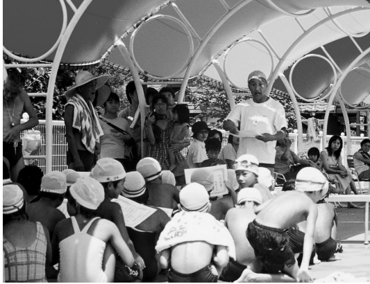
1ヶ月間の練習を終え、修了証が手渡された

い子どもたちには平泳ぎやクロールの泳法を身につけさせ、上級者には力も泳ぎなどの古泳法を伝授しています。今年も、再開後最高の73名の参加者があり、このうち上級合格の3人が見事卒業しました。