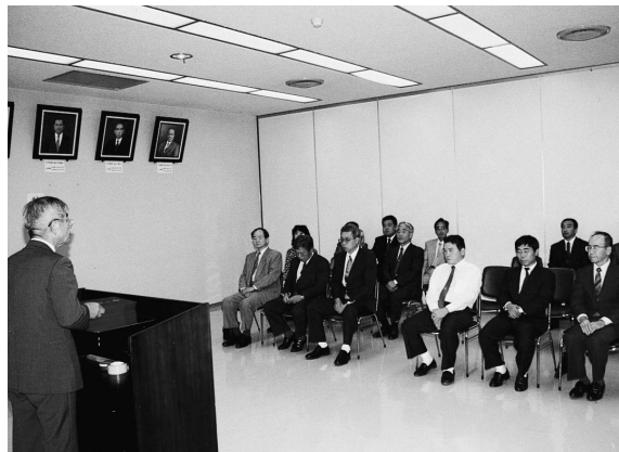
当選証書の授与式