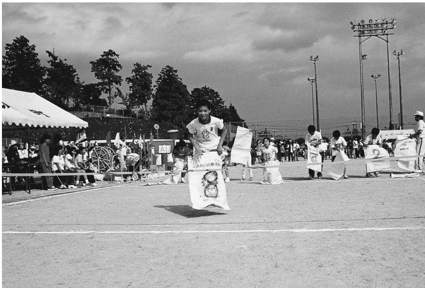
ゴールに向かって一直線

なかでも、職域や地区の代表らで参加する「ジャンボなわとび」や「つなひき」では、応援の歓声が飛び交い、秋晴れの下たく